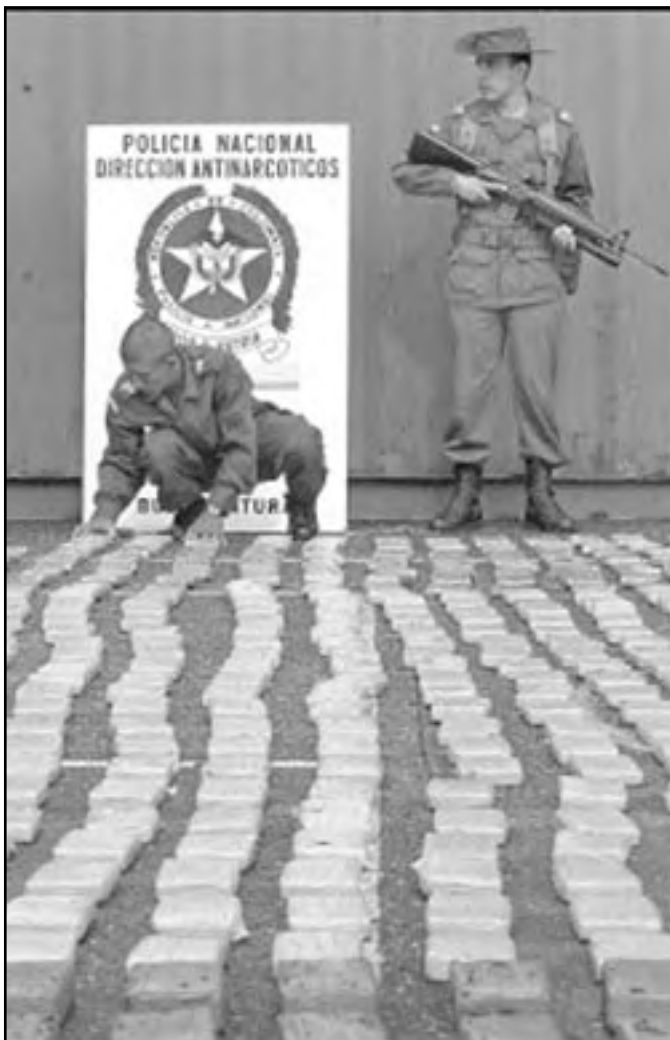
Un cantidad grandi di droga confisca.

QUITO—E hefe di e Comando Sur di Estados Unidos, general Bantz Craddock a admiti ayera na Quito e imposibilidad di derota por completo e narcotrafico y terrorismo, aunke el a reitira cu su pais ta sigui respalda economicamente e lucha andina contra esakinan.